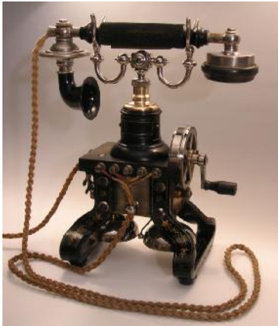
Alexander Graham Bell brachte 1876 das Telefon erstmals zur praktischen Anwendung