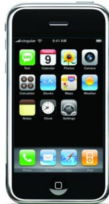
2011 können Sie mit Ihrem Handy jeder Zeit online sein, Mails abrufen, Flüge buchen, Parktickets lösen und sogar telefonieren J